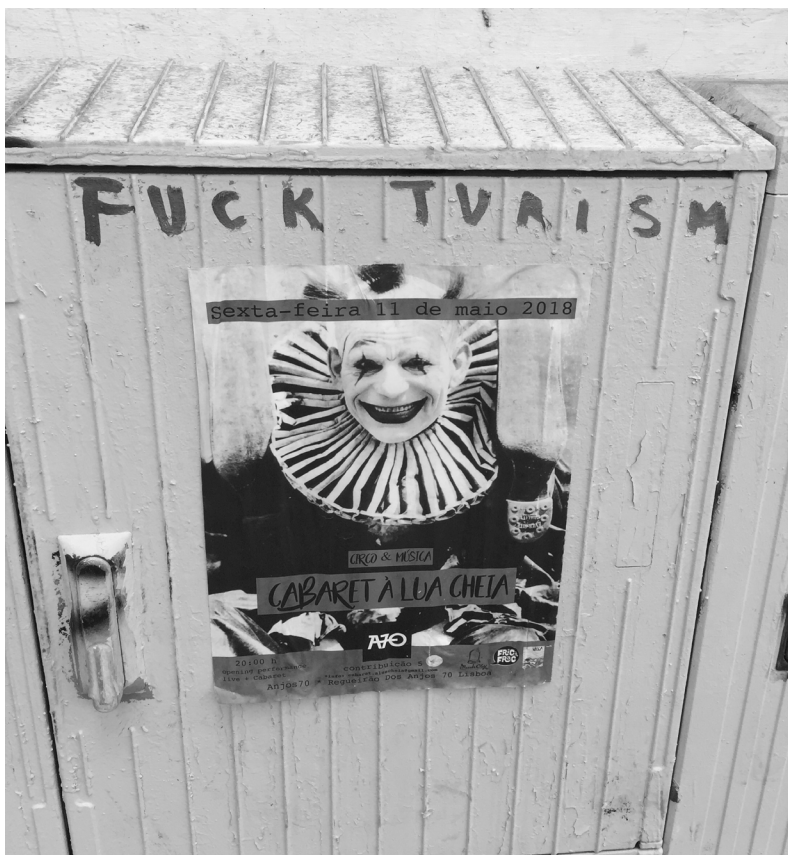
(Lisboa, agosto de 2021)